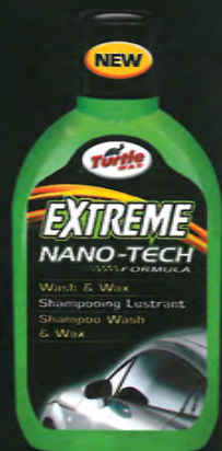
500 ml 1L 2.5L 5L