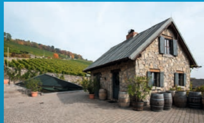
Weingut am Stein - Ludwig Knoll, Mittlerer Steinbergweg 5, 97080 Würzburg